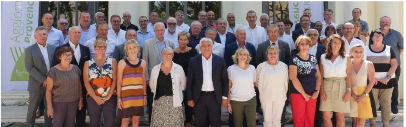
Didier BREMOND, Président de l'Agglomération de la Provence Verte entouré par les nouveaux conseillers communautaires des 28 communes membres

L'Agglomération a les atouts pour assurer ses missions et ses fonctions, Forcalqueiret est un partenaire loyal et vigilant pour l'intérêt de tous.